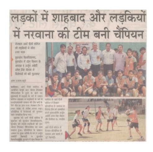
State level Handball Championship (Male & Female) (2-4-2016)