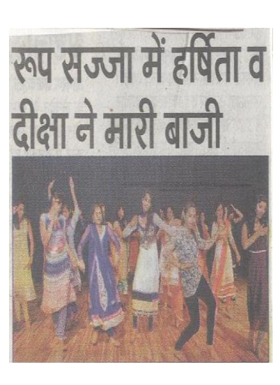
Makeup and Hair Care Competition by deptt of Hindi (5-4-2016)