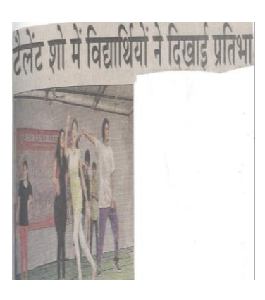
Talent Search Competition