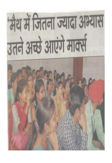
Seminar on Basics of Mathematics by Deptt of Mathematics (3-4-2016)