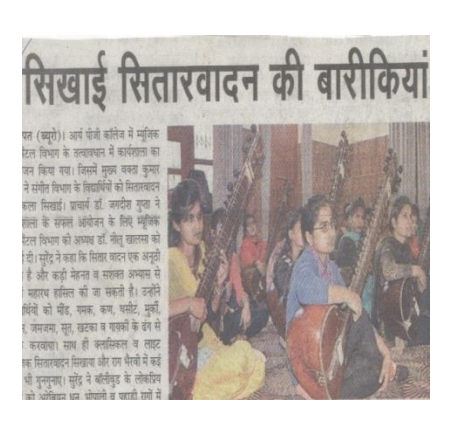
9.2.2016: Workshop on Art of Sitar Playing by Deptt. of Music (Instrumental)