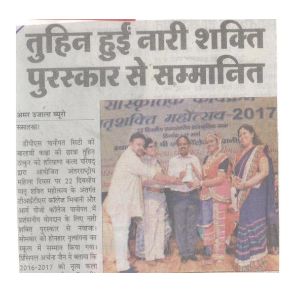
Matrishakti Mahotsav (4-4-2017)