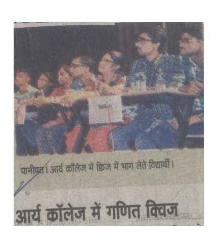
9.3.2017: Quiz Contest on Mathematics by Deptt. Of Mathematics